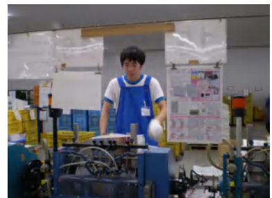
カタログのセッティング

お問い合わせは 春日部特別支援学校 進路指導部まで 春日部市八丁目776-1 TEL 048-761-1991